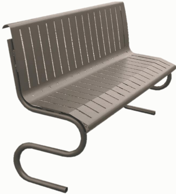
Version acier protégé corrosion laqué MANGANESE, longueur 1770 mm